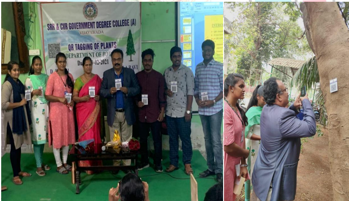
QR Tagging of Plants in Campus by Botany Students on 09-02-2021