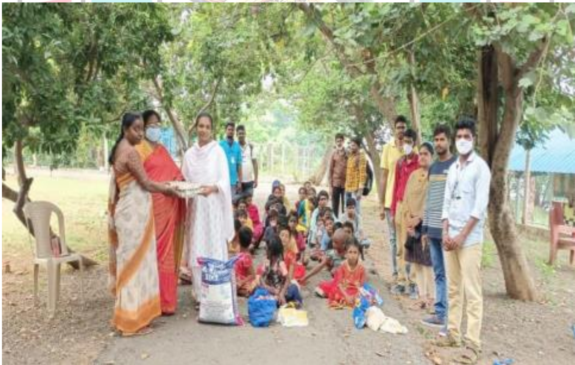
Distribution of 25 Kg Rice Bags and Groceries to the Orphans in Chiguru Children's Home by Social Work Students on 23-10-2021