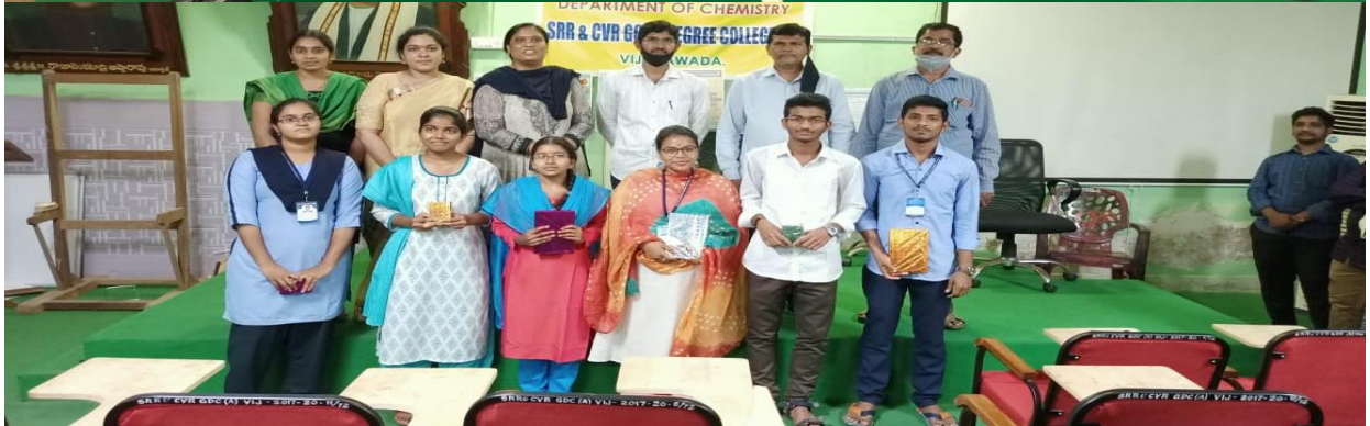
Celebrations of National Science Day on 26-02-2021 & 27-02-2021