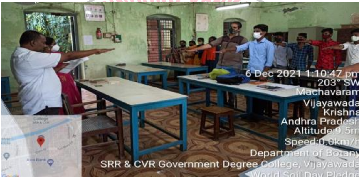
Participated in Pledge on World Soil Day on 06.12.2021