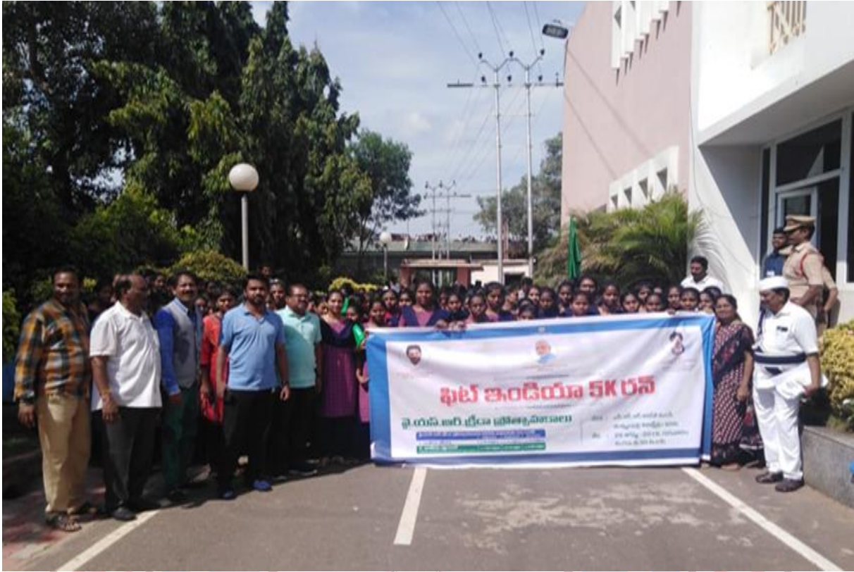
Participation in the Fit India 5K Run on 10-10-2021