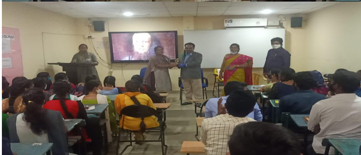
Celebrations of National Mathematics Day on 22-12-2020