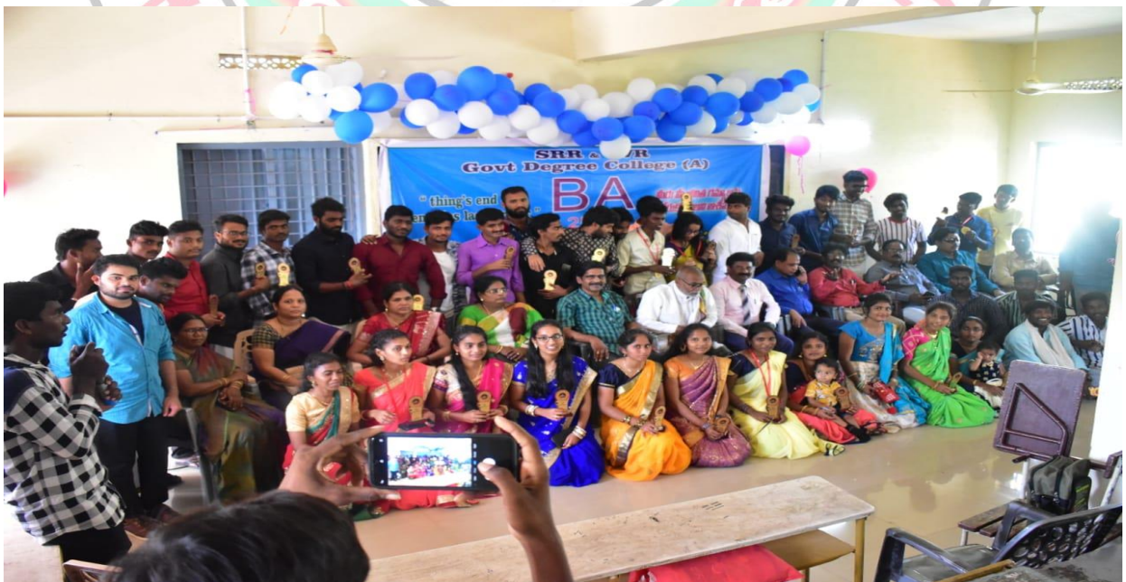
Celebrations of Farewell Party of B.A. Students on 15-03-2021