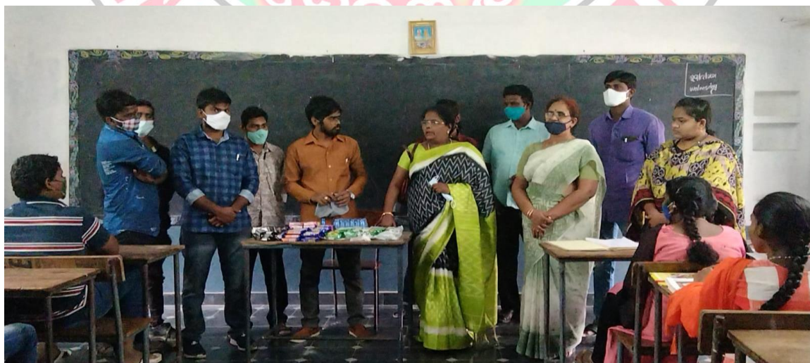
Distribution of Detergents to Students in Vijaya Meri Blind School by Sociology & Social Work Students on 28-11-2020