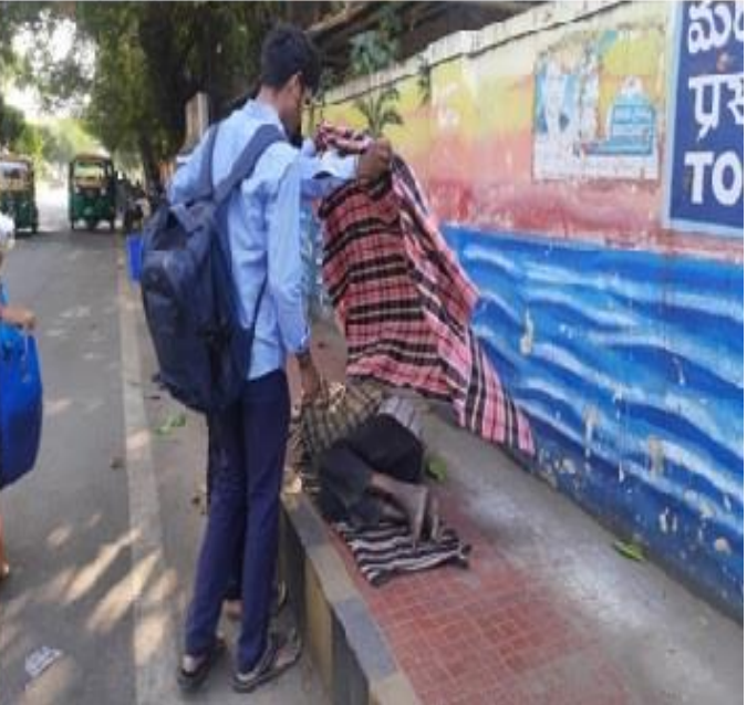
Distribution of Bed Sheets to Roadside Living People by the students of Philosophy on 21-12-2021