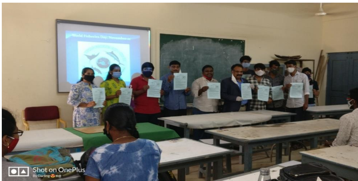
Celebrations of World Fisheries Day on 21-11-2020