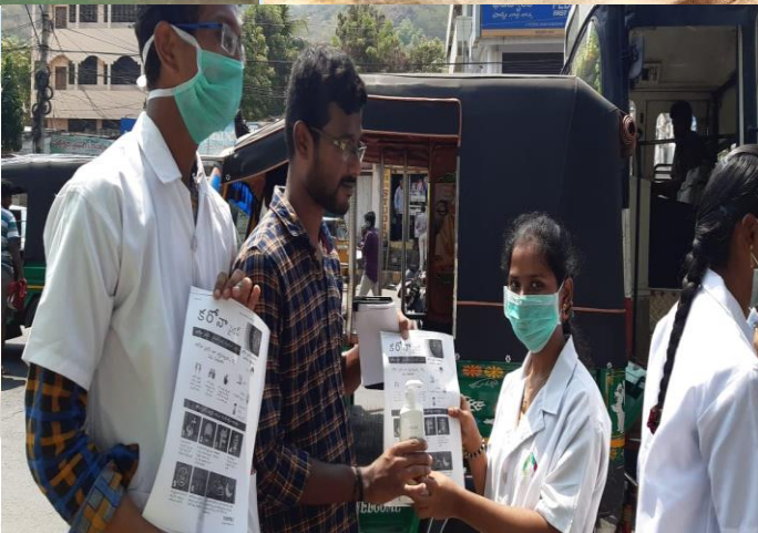
Awareness about Covid 19 on 09-08-2020