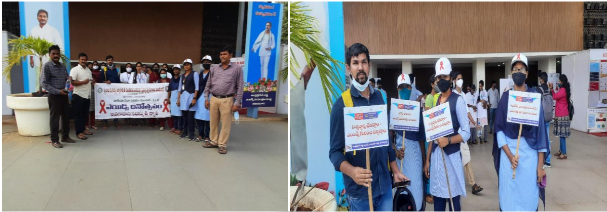
Participation in Aids Day Rally on 01-12-2021