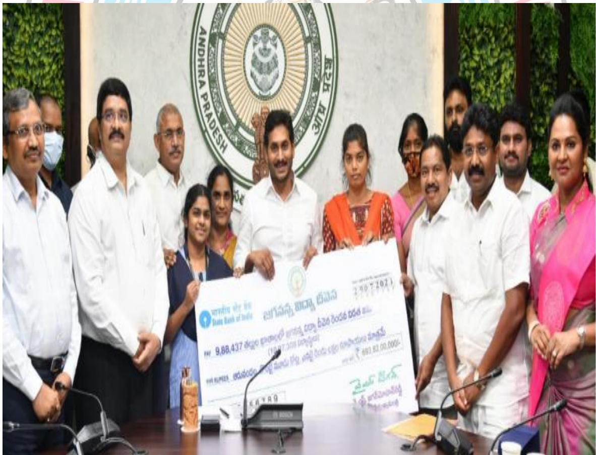
Participation in Govt. Scheme JVD Distribution Program and Received the Cheque from Honourable CM Sri Y.S. JAGAN MOHAN REDDY Garu on 29-07-2021