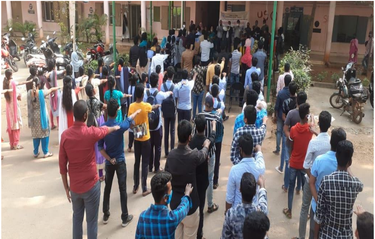
Celebrations of National Voters Day on 25-01-2021