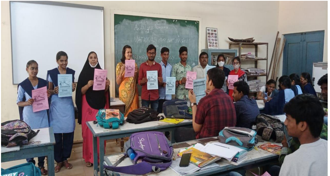
Participation in National Vaccination Day on 16-03-2021