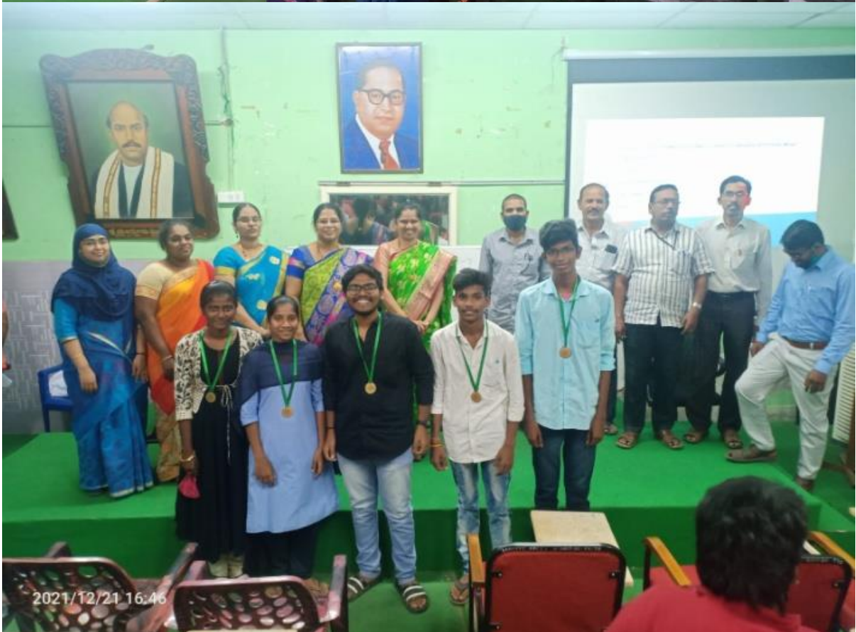
Celebrations of National Mathematics Day on 21-12-2021