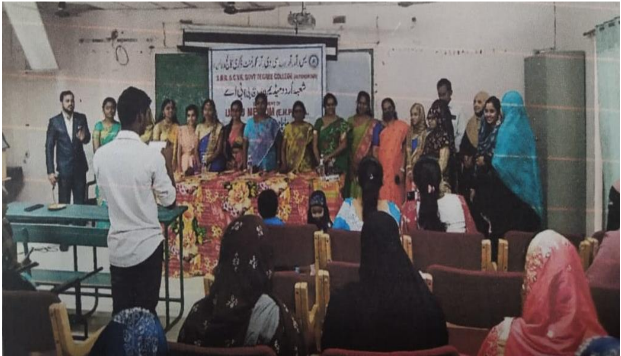
Celebrations of Fresher's Day of B.A. Urdu Students on 18-12-2021