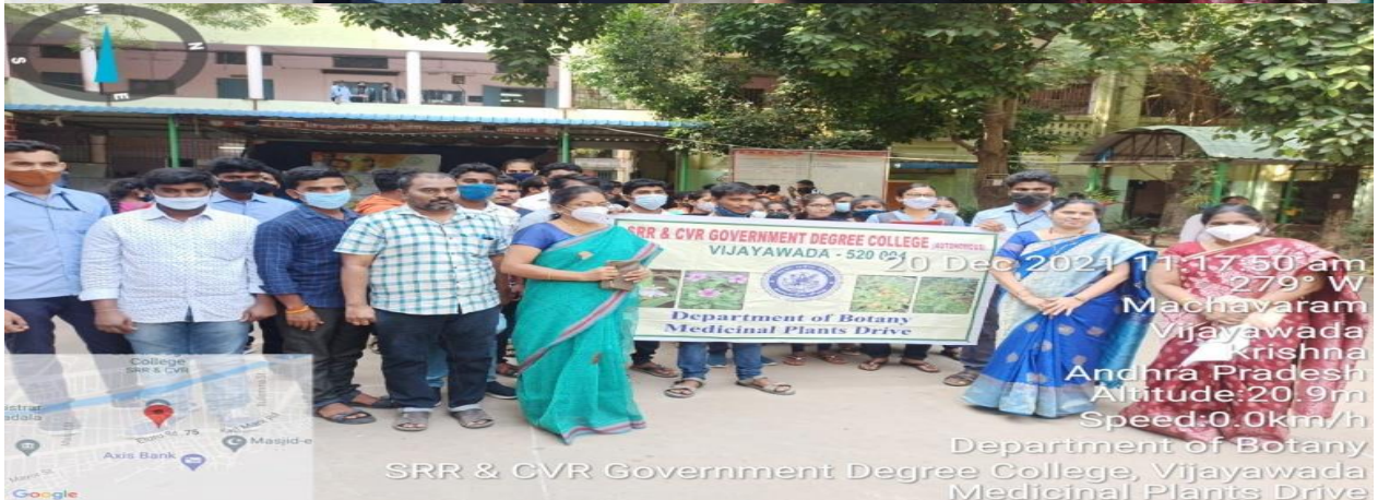
Awareness on Medicinal Plants Drive in Machavaram Area on 20-12-2021