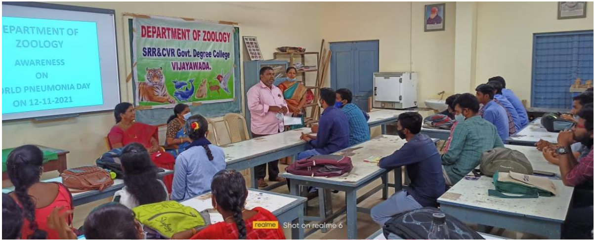
Participation in Awareness on Pneumonia on the Eve of World Pneumonia Day on 12-11-2021