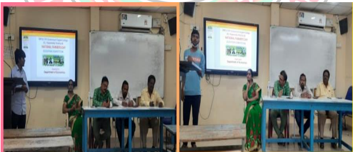
Participation in Elocution Competition on the Eve of National Farmer's Day on 18-12-2021