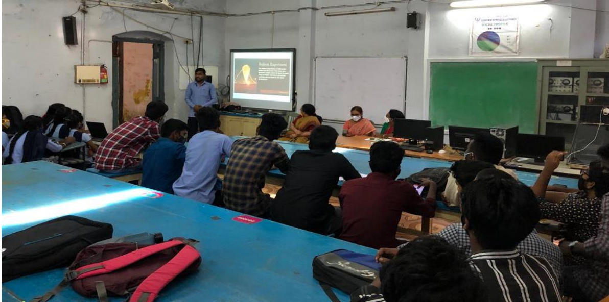
Celebrations of World Space Week on 07-10-2021