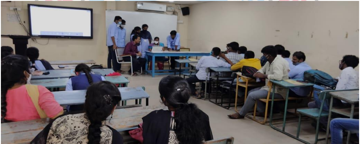
Supported in One Time Registration of APPSC Exams on 17-11-2021