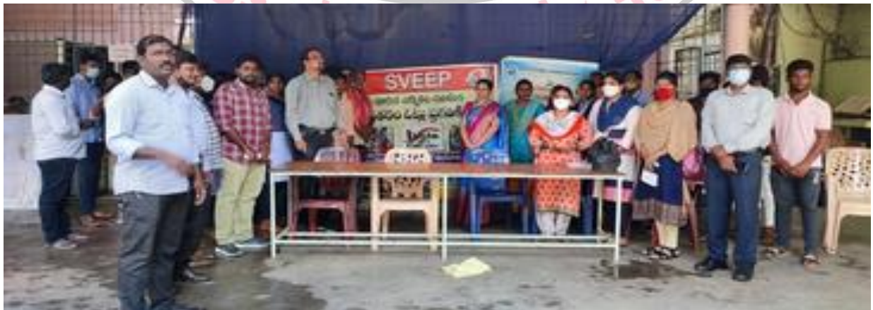
Participation in Voter Enrolment Program under SVEEP on 19-11-2021