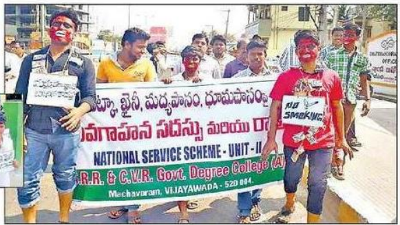
మద్దపానం, ధూమపానం, డ్రగ్స్ పై చైతన్య ర్యాలీ