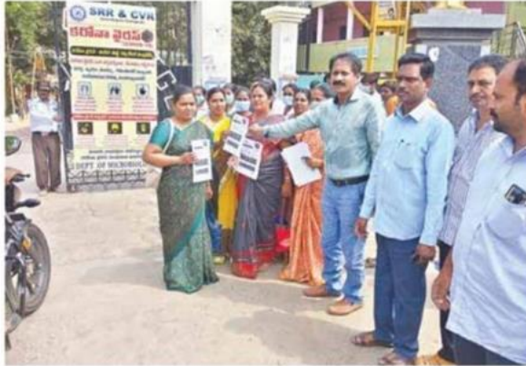
HANS NEWS SERVICE

Vijayawada: As part of the efforts to create awareness on the Covid-19, the SRR and CVR government college staff distributed pamphlets to the students and the invigilators who attended the intermediate examinations on Thursday. Microbiology and Botany department