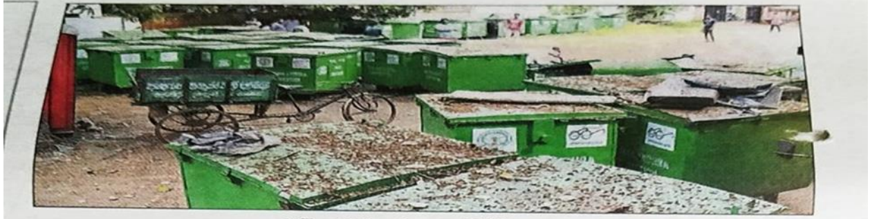
డస్ట్ బిన్లను మూలపడేసి..