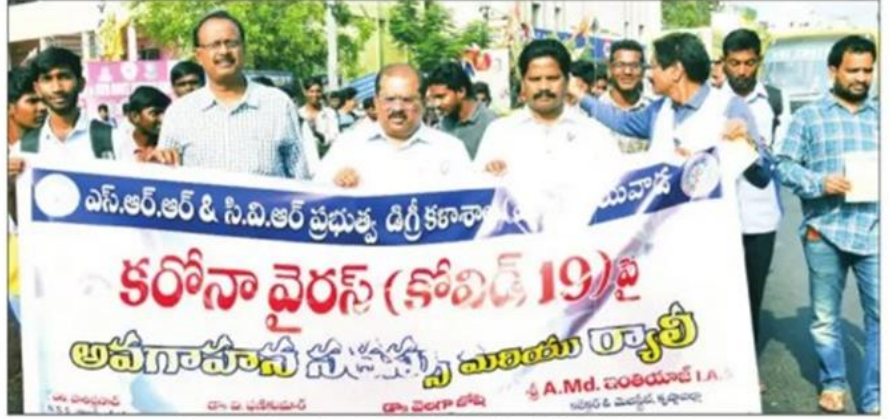
కరోనా వ్యాధిపై ర్యాలీ నిర్వహిస్తున్న కలెక్టర్, ఎస్ఆర్ఆర్ ప్రెసిపల్, విద్యార్థులు