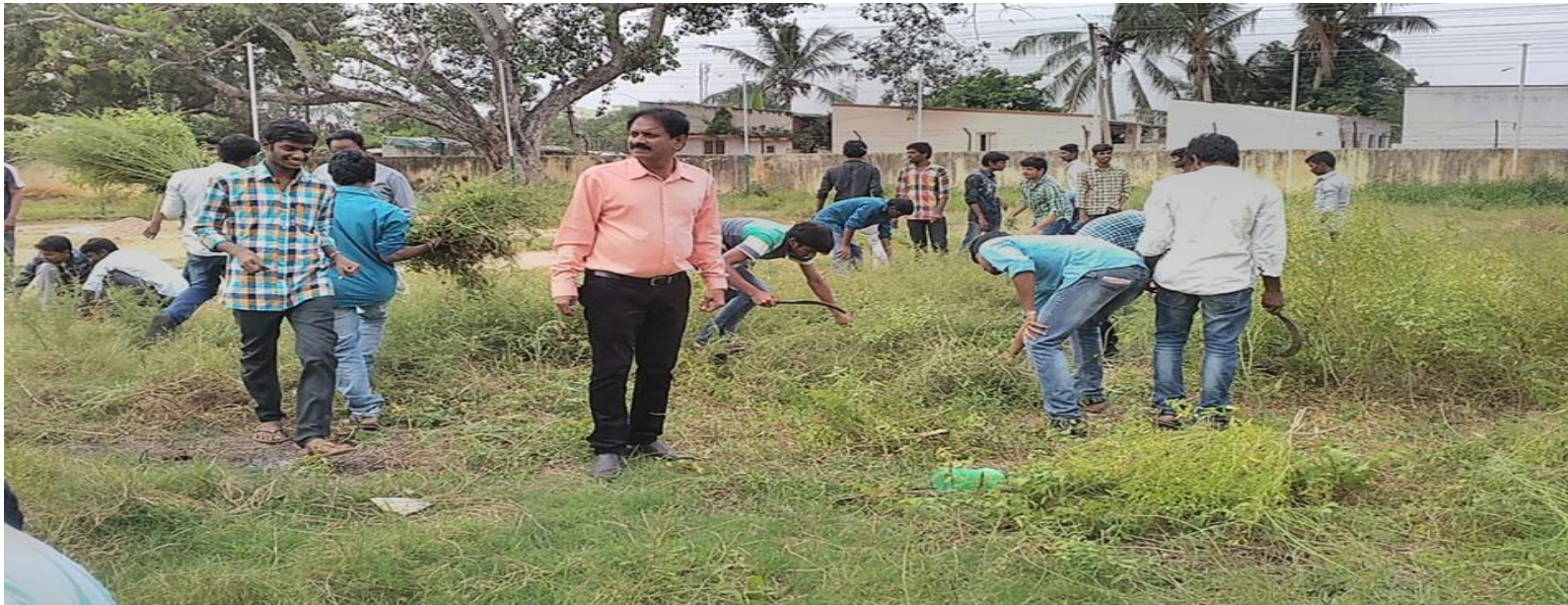
NSS units of the SRR & CVR College (A), Vijayawada organized Swachh Bharat program and also conducted an awareness on cleanliness of surroundings in Gollapudi Village