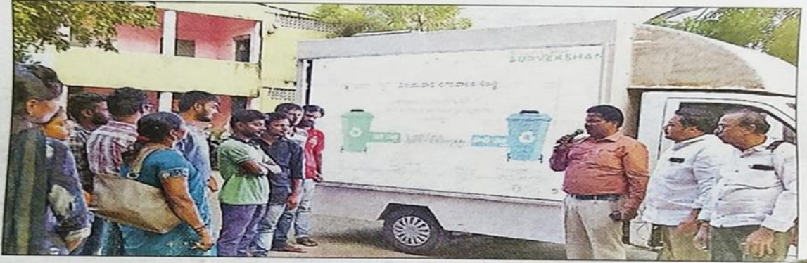
చెత్తను విడివిడిగా డబ్బాల్లో వేయాలని ఎల్ఈడి తెరలపై ప్రచారంచేస్తూ..