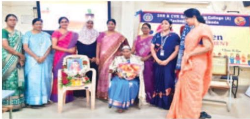
SRR & CVR Government Degree College women's empowerment wing felicitating a retired woman teacher in the college premises in Vijayawada on Tuesday

HANS NEWS SERVICE VIJAYAWADA (NTR DISTRICT)