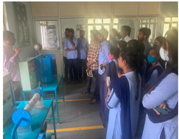
On 07/01/2023, III BSc MPC & MPCs students visited to low temperature Physics lab at PVP Siddhartha Engg. College, Kanuru, Vijayawada.