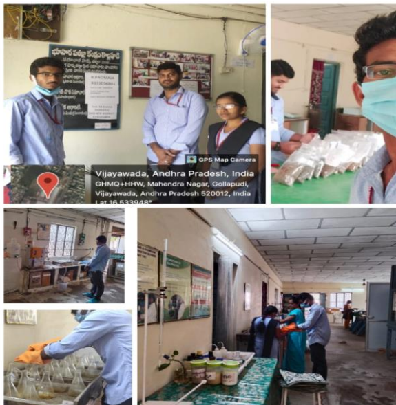
On 07/01/2023 III MPC students from the department of Chemistry attended Hands-on training session the on analysis of Agricultural soil samples at Agriculture soil testing laboratory, Gollapudi, Vijayawada.