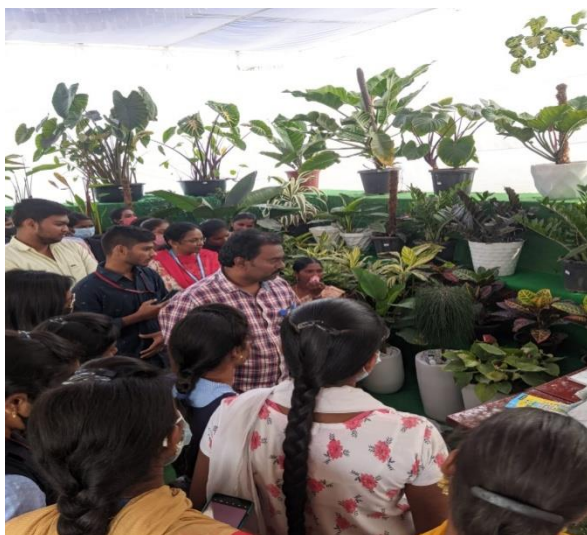
On 07/01/2023, Students from the department of Botany and Horticulture visited State Level Agrihorticulture show at Siddhartha College of Hotel Management in Vijayawada.