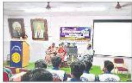
మాట్లాడుతున్న అధ్యాపకులూలు చిత్రం